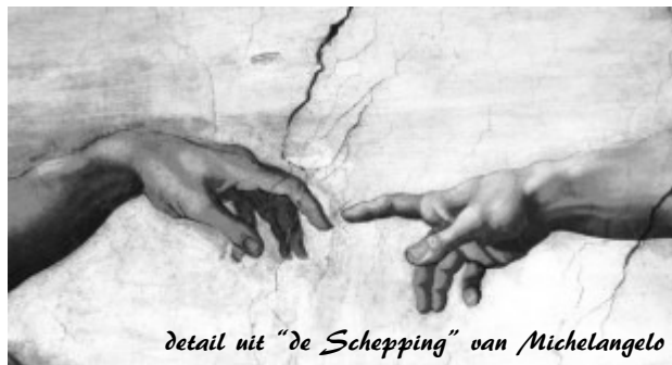
detail uit "de Schepping" van Michelangelo